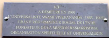
Plaque commémorative de Swami Vivekananda

Une plaque commémorative (39 rue Gazan 75014 Paris) rend hommage à ce grand humaniste.