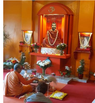
Puja au Centre Védantique Ramakrishna de Gretz 13 mars 2022

Aujourd'hui nous célébrons l'anniversaire de la naissance de Sri Ramakrishna. Dans beaucoup d'endroits, en Inde, à Belur Math, en Europe également, on célèbre l'anniversaire de Sri Ramakrishna le jour de sa naissance et le dimanche suivant. Cette tradition a débuté quand Sri Ramakrishna était encore vivant. Il vivait à Dakshineswar et de nombreux dévots qui venaient le voir ne pouvaient se libérer en semaine, ils étaient occupés par leur travail, leur famille... Ils venaient le jour de congé suivant pour célébrer l'anniversaire de Sri Ramakrishna. Ils chantaient tous ensemble, ils écoutaient les enseignements de Sri Ramakrishna, ils prenaient le prasad ensemble. C'était un jour de joie pour tous les dévots. Cette tradition a perduré jusqu'à maintenant. Les dévots viennent dans différents centres pour célébrer ce jour dans la joie comme nous le faisons en France, en Europe. Nous nous retrouvons tous ici aujourd'hui, nous avons célébré la puja ii , nous avons eu notre prasad et maintenant nous sommes ici pour écouter l'histoire de sa vie et son message.