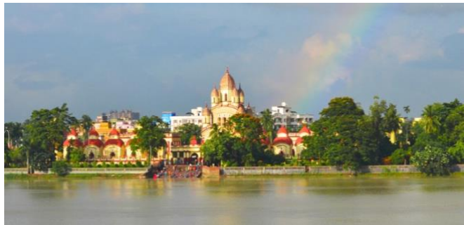
Temple de Dakshineswar

Ramakrishna faisait la puja pour Ramchandra. A Dakshineswar, il commença à faire une puja dédiée à la Mère divine Kali. Dakshineswar n'est pas seulement un temple de Kali, c'est un complexe de temples avec 12 temples de Shiva, un temple de Radhakrishna et le temple de Kali bien sûr. Il faisait la puja dans tous les temples, mais avait un attachement