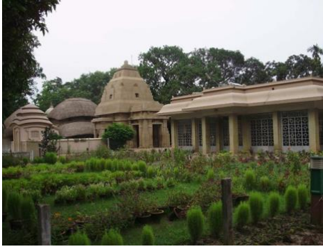
Maison ancestrale de Sri Ramakrishna et temple, Kamarpukur

heureuse car ils étaient restés sur le chemin de la vérité. Ses frères sont partis dans différents endroits et Khudiram, le père de Sri Ramakrishna, a été accueilli par un ami dans le village de Kamarpukur. Cet ami leur a donné une petite maison, une petite parcelle de terrain. Ainsi ils pouvaient cultiver et vivre. Si vous allez aujourd'hui à Kamarpukur vous verrez cette même maison en terre qui est conservée et entretenue comme à l'époque. Ils avaient pour habitude de commencer la saison des cultures avec des prières et de la vénération. Et cette petite parcelle de terre était suffisante pour les nourrir. Cette