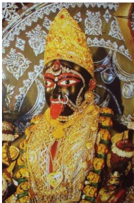
Kali, la Mère divine

Sri Ramakrishna vénérait Kali dans le temple, il pria la Mère Divine : « Dans ce monde il y a tant de gens, il y a tant de façons de vénérer Dieu ! Oh Mère, je veux les voir, je veux expérimenter leurs voies. Je veux comprendre comment ils ont pu se réaliser de différentes façons ». Il s'agissait d'un arrangement divin : la Mère divine a organisé différentes choses pour lui qui lui ont permis de suivre les différentes voies. Et il expérimenta les voies par lesquelles ces gens s'étaient libérés. En Inde, la liberté religieuse est très importante. Il y a tant d'Écritures, d'âmes réalisées. Toute personne qui réussit instruit la prochaine génération. Il y a donc de nombreux chemins que les gens essaient de pratiquer et si on est sincère, on peut progresser rapidement. Sri