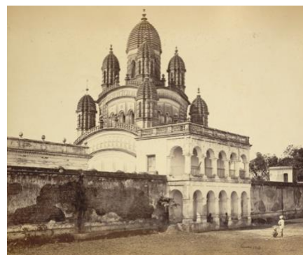
Temple de Kali à Dakshineswar

Ramakrishna réalisa ces différentes voies. Il dit ensuite qu'il ne s'agit pas uniquement d'accomplir les rites et rituels, on doit avoir l'envie profonde de se réaliser. Sans cette motivation, cette sensation d'urgence ce n'est pas vraiment possible. Pour réaliser la vérité en vous, quel que soit le chemin que vous vouliez suivre, vous devez avoir cette envie, cette sensation d'urgence.