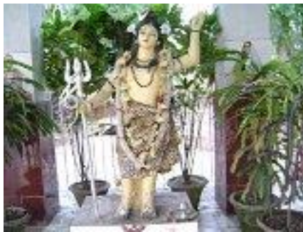
Statue de Ramakrishna enfant en extase pendant la représentation de Shiva

Sri Ramakrishna avait de nombreuses qualités : il pouvait peindre, sculpter, jouer des comédies, mais il y avait autre chose. Souvenons-nous d'un incident lors de la fête de Shivaratri . L'artiste qui devait jouer le rôle de Shiva était malade. Les villageois demandèrent à Ramakrishna de jouer ce rôle. Il fut habillé en Shiva et apparut sur la scène. Son esprit était