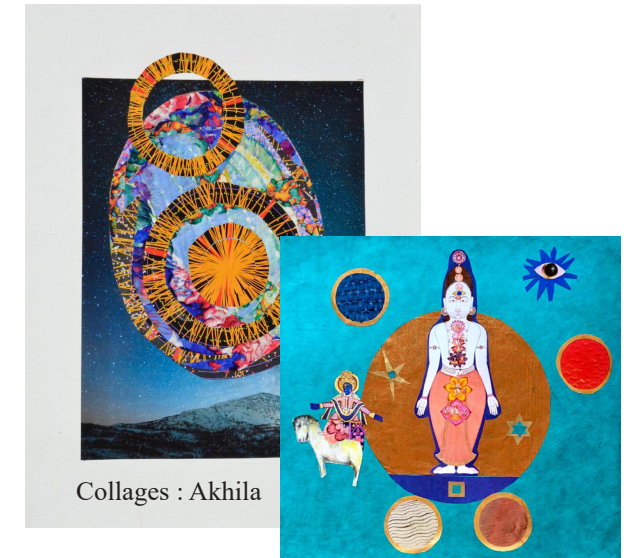
Collages : Akhila